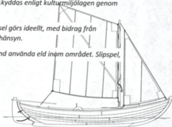
13 fots JAKTKANOT

Området beträds på egen risk. Det är förbjudet att utan tillstånd använda eld inom området. Slipspel, slipvagn och andra anläggningsdelar får inte vidröras.