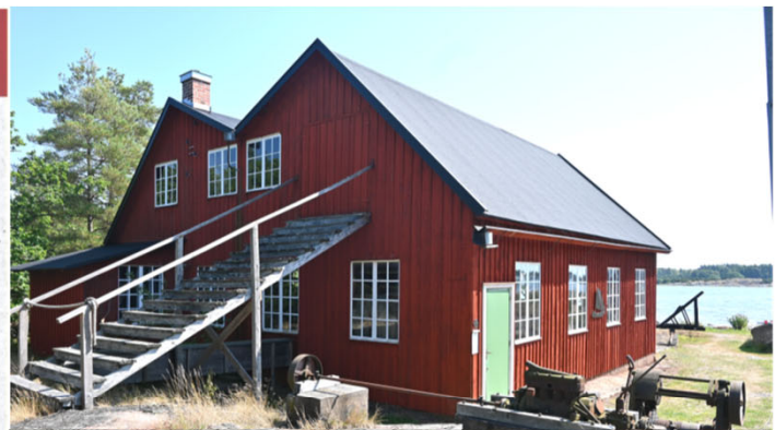
Ritad av Bertil Andersson