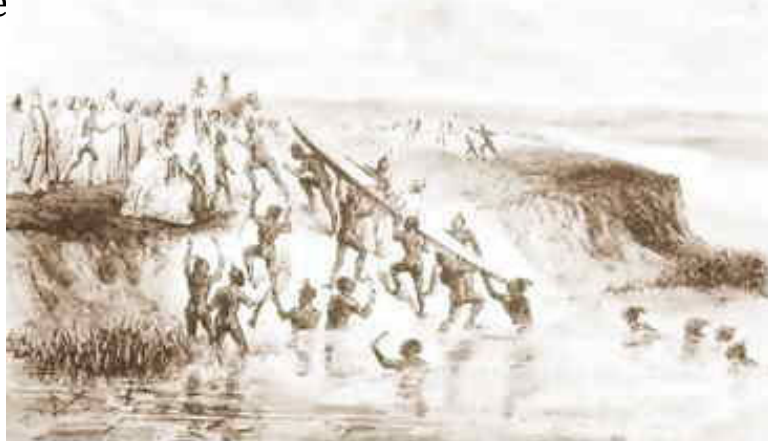
Capture of the Rob Roy on the River Jordan